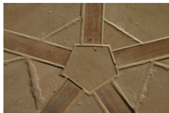
Vijfhoek bij entree