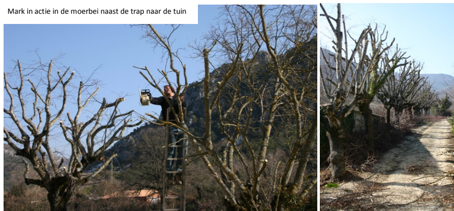
Mark in actie in de moerbeï naast de trap naar de tuin

En nu is het aan ons om al het snoeihout te verwerken.