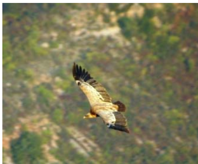
Vale gier - Remuzat