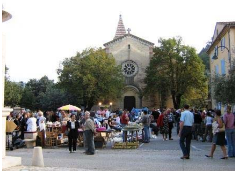
Vide grenier - Entrechaux